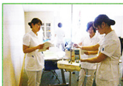
輸液ポンプの使い方を学ぶ