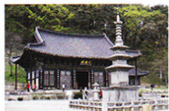
直指寺（ジッチサ）の大塔殿（デウンジャン）

最後に、金泉と言えば欠くことのできないのが直指寺（ジッチサ）です。なんと1600年の歴史を持つ直指寺には国宝第1576号のデウン殿（ジャン）があります。その前には黄岳山（ファンアクサン）があり、直指寺（ジッチサ）の大塔殿（デウンジャン）自然と調和のとれたデウン殿の姿がもっと美しく見えます。周辺には、飲食店がずらりと並んでいて金泉の