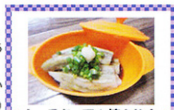
トースターで☆焼きなす