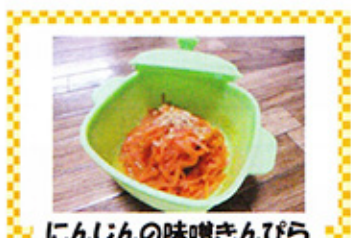
にんじんの味噌きんぴら