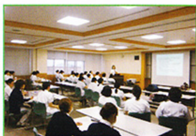
専門看護師から倫理教育の講義を受ける

この一年間、名札に「若葉マーク」をつけたフレッシュな看護師を見かけましたら、暖かい応援をよろしくお願いします。