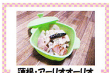
蓮根・アーリオオーリオ