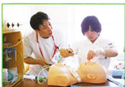
先輩の指導を受けながら吸引の練習