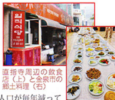
直指寺周辺の飲食店（上）と金泉市の郷土料理（右）

直指寺ならではの郷土料理が味わえますし、最近では直指寺で伝統婚礼を挙げる新郎新婦も多くなっていて観光客の足が向いているようです。