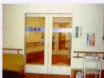
病棟入り口の自動二重扉