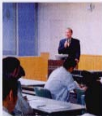
第3回目講演する 埼玉病院 関塚副院長