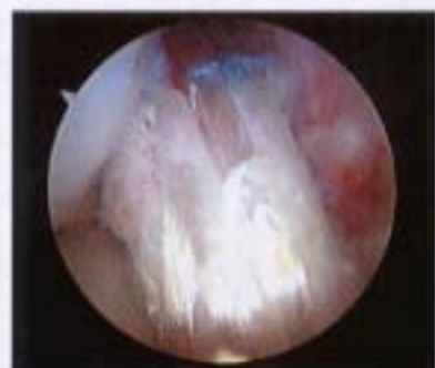
図3:再建した前十字靭帯の関節鏡視像

ます。今後も地域の中核を担う急性期病院を目指し、またスポーツによる外傷にも十分対応できるように、真心のこもった医療を展開できれば幸いです。そして広く山梨県各地から訪れてくれる患者の期待に応えていけるよう真摯に診療に望んでいきます。