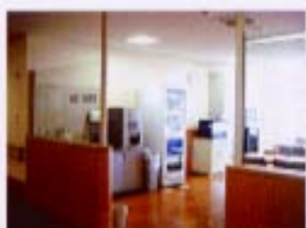
食堂・談話室の自動販売機