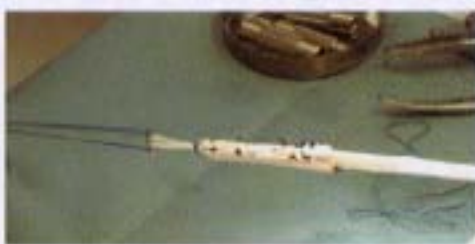
図2:膝屈筋腱から作製した再建用靭帯

視下手術や靭帯再建術を最新の関節鏡システムを使用して積極的に行っていきます。山梨県下には膝関節外傷専門、特に靭帯再建術を積極的にやっている病院はないため、徐々に紹介患者数も増加し、平成十八年に入ってから既に十件以上の半腱様筋腱を使用した前十字靭帯再建術を施行し(図2、3)、概ね良好な成績を上げていきます。今後、膝関節の疼痛や不安定性等のある症例がありましたらご紹介いただければ幸甚に存じます。