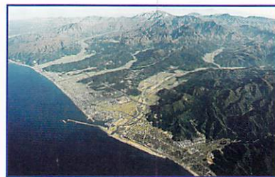
日本初の『世界ジオパーク』に認定された、糸魚川の雄大な自然

最後に第1位の『日本初世界ジオパークの認定』です。ジオパークとは科学的に見て特に重要で貴重な、あるいは美しい地質遺産を複数含む一種の自然公園です。世界ジオパークはユネスコが支援する世界ジオパークネットワークへの加盟を認定された地域で、日本にはまだ4つの地域しかありません。