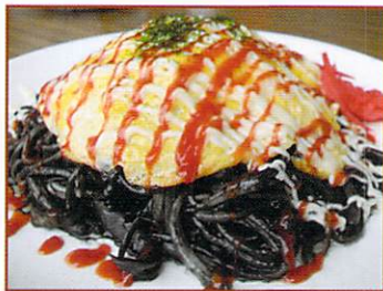
B級グルメ『ブラック焼きそば』

まずは第3位のB級グルメ『ブラック焼きそば』。中華麺と新潟県産のイカにイカ墨を加えて作る焼きそばで、味覚と視覚のインパクトが強く、両方が楽しめる一品です。「新潟うまさぎっしり博」のグランプリを獲得した程の実力で、とてもおいしい一品でした。イカ以外に使う具材や味付けはお店によって工夫されているので、近くにお寄りの際は食べ比べてみてください。