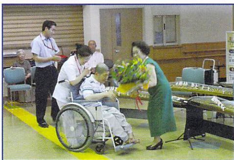
演奏終了後、入院患者さんによる花束贈呈