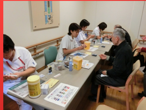
食事前後は血糖値を測定

1月25日(金)に糖尿病教室の食事会が開催され、定員を超える多くの参加申し込みがあり、70名の方が参加されました。当院の管理栄養士が作成した献立をもとに岡島ローヤル会館の志智料理長が腕によりをかけたおせち料理を多くの方が堪能されていきました。お食事以外にも糖尿病について当院の糖尿病療養指導チームによる講演も行われました。