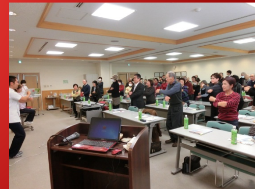
食事後は話題のラジオ体操