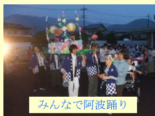
みんなで阿波踊り