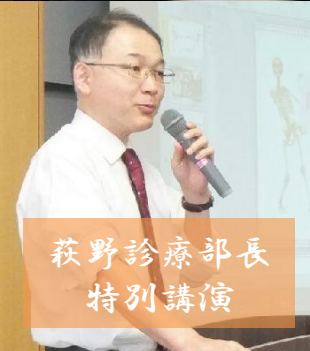
萩野診療部長 特別講演