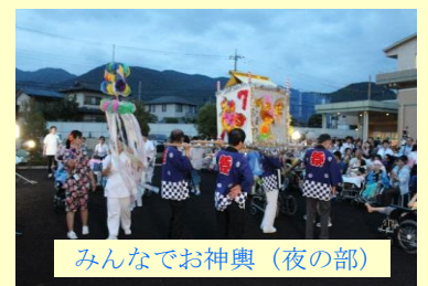
みんなでお神輿(夜の部)