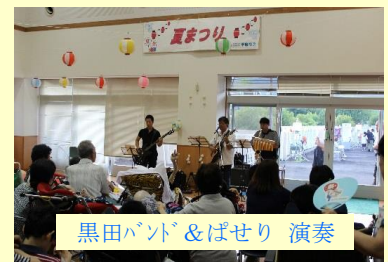
黒田バンド&ぱせり演奏