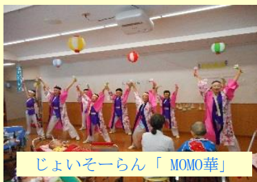
じょいそーらん「MOMO華」