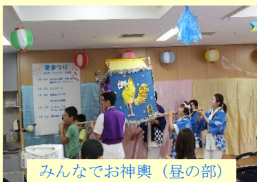
みんなでお神輿(昼の部)

ご来賓、ご家族、ボランティア他、皆様のご協力により、楽しい夏の一時を過ごす事ができました。