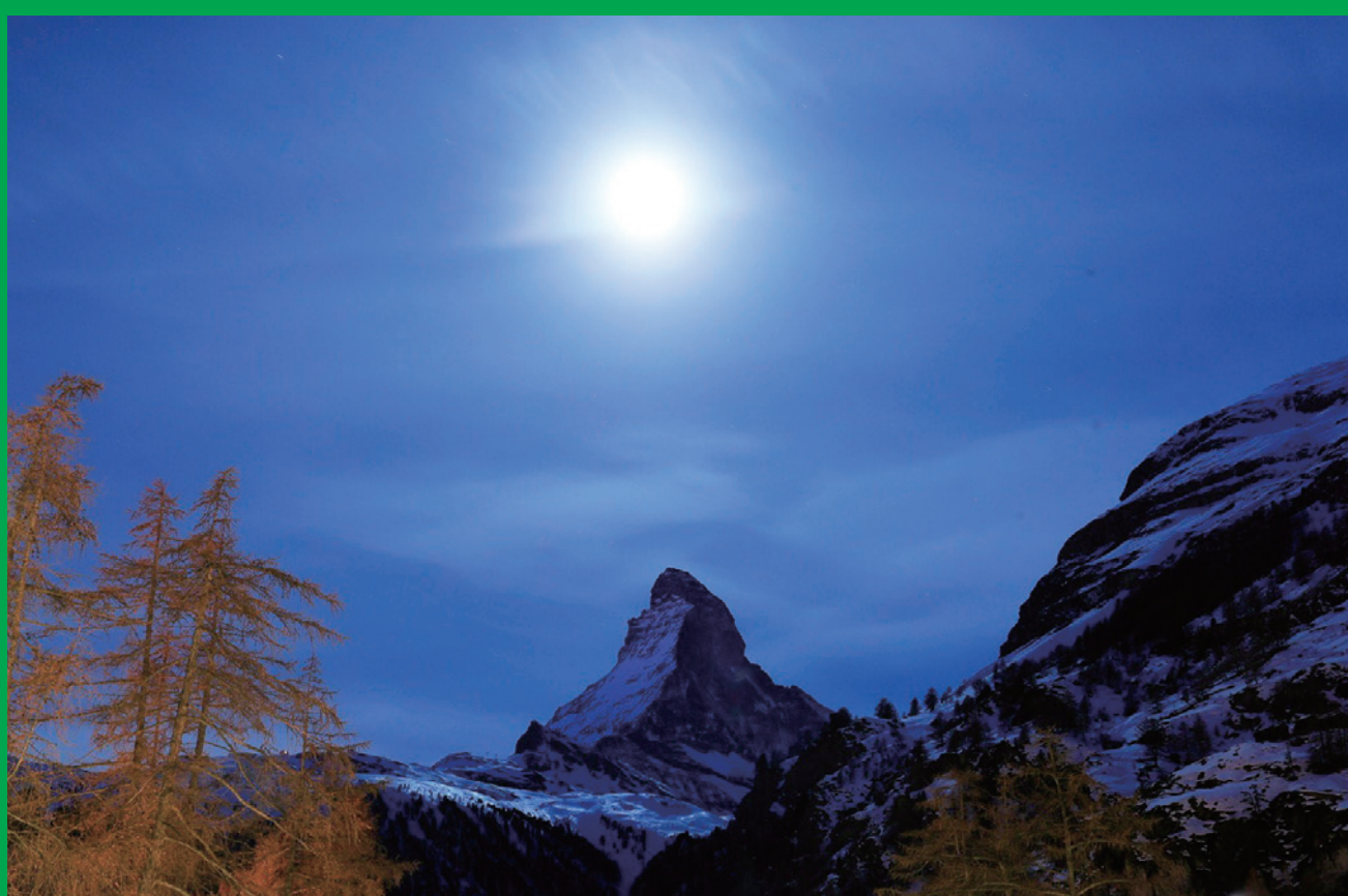
マッターホルンに沈みゆく満月（患者さん投稿）