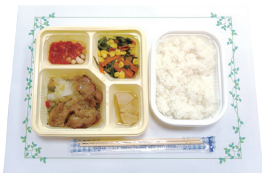
↑エネルギー・塩分調整食 (1食 484kcal 食塩相当量 1.8 g)

今後も当院では、多職種が連携し、患者さんの生活に寄り添った教育・啓発活動を継続してまいります。