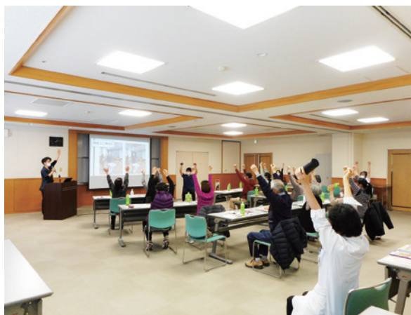
↓理学療法士による運動指導